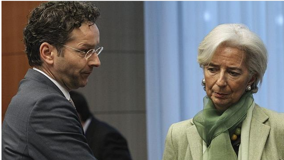
El ministro de Finanzas holandés y presidente del Eurogrupo, Jeroen Dijsselbloem, y la presidenta del FMI, Lagarde

► Se ha pactado una ayuda de 10.000 millones de euros con la condición de aceptar una quita a todos los depósitos